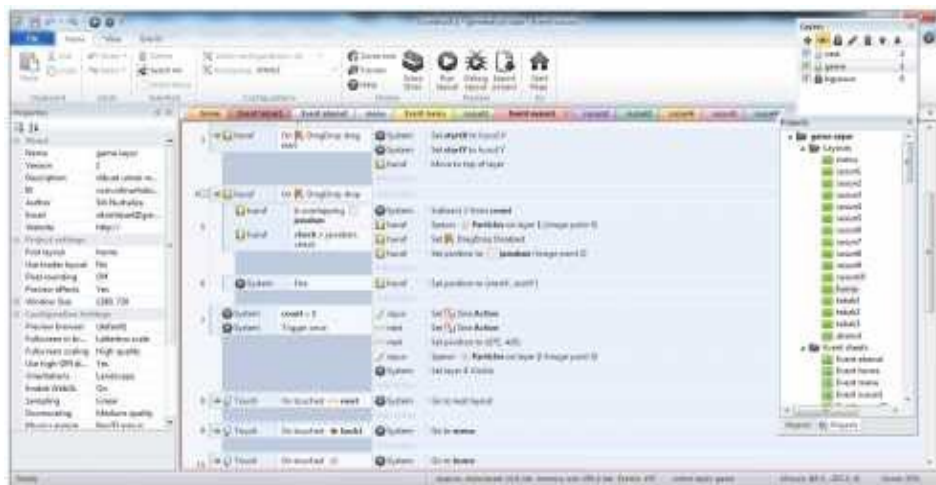
Gambar 4. Proses Pembuatan Event Sheets