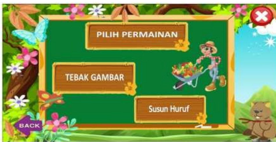
Gambar 6. Tampilan Menu Pilihan Game

Tampilan menu pilihan game adalah tampilan halaman yang menampilkan pilihan permainan yang akan dimainkan. Dalam menu pilihan game ini terdapat 2 jenis permainanyaitu tebak gambar dan susun huruf.