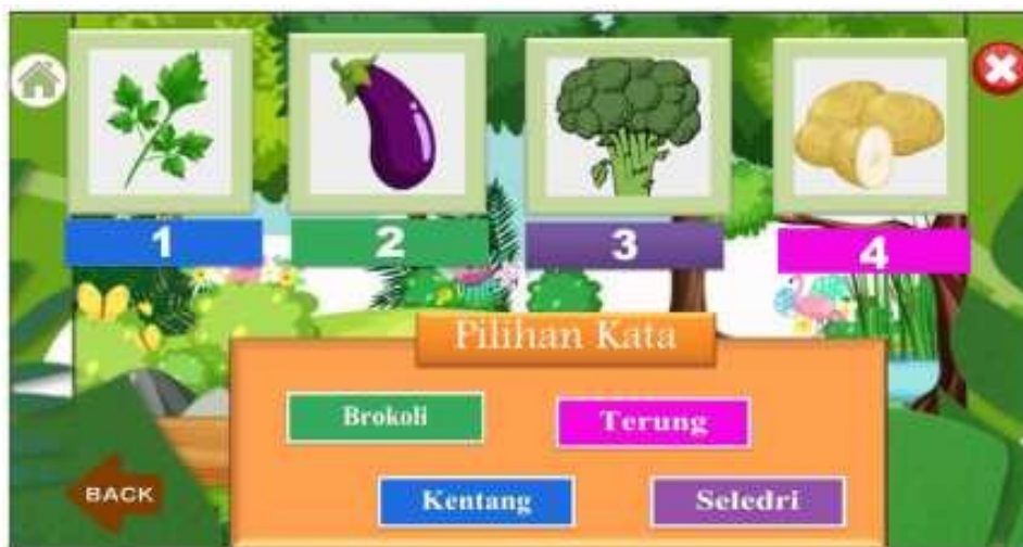
Gambar 7. Tampilan Permainan Tebak Gambar