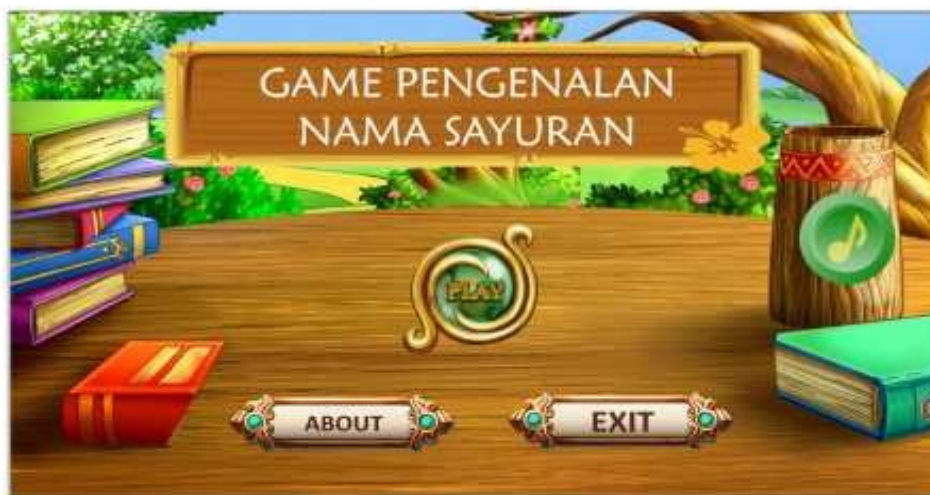
Gambar 5. Tampilan Beranda

Tampilan beranda atau homepage adalah halaman awal yang berisi beberapa fitur menu tombol yaitu seperti tombol button player , tombol button exit , tombol button about dan lain-lain. Pada halaman menu ini penulis menggunakan counstruct 2 untuk tata letak menu tersebut dan powerpoint untuk mendesain bagian tombol menu.