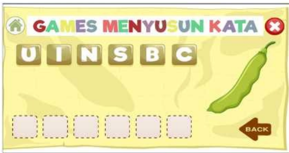
Gambar 8 Tampilan Permainan Susun Huruf

Permainan susun huruf ini dibuat dengan menggunakan teknik drag and drop agar player bisa menyusun huruf dengan benar. Cara memainkan dengan cara mengklik salah satu huruf dan di drag ke kolom jawaban yang ada di bawah. Apabila penempatan susunan huruf benar pada kolom jawaban maka huruf akan tetap pada kolom jawaban dan apabila penempatan huruf salah maka huruf akan kembali pada tata letaknya yang semula.