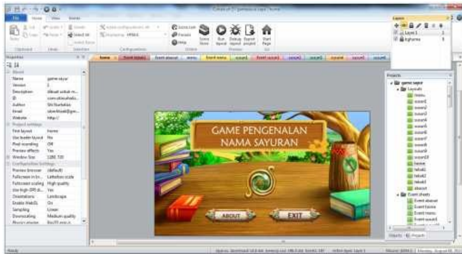
Gambar 3. Proses Pembuatan Game Pengenalan Nama Sayuran