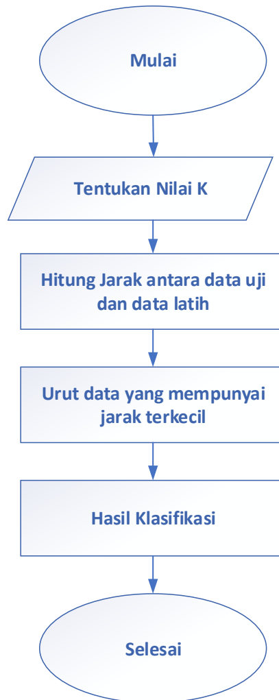
Gambar 1. Proses Metode K Nearest Neighbour

Adapun tahapan algoritma KNN adalah sebagai berikut: