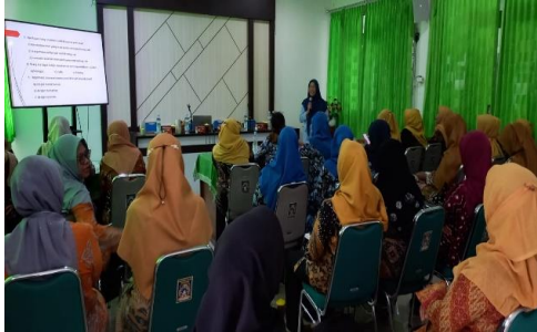
Gambar 3. Pemaparan Materi

mengenalkan Bahasa Inggris kepada AUD melalui penggunaan gambar, lagu, gerak, dongeng, permainan yang menyenangkan, seperti mengenal angka, buah, benda-benda di sekitar, dan lainnya yang dapat menarik minat AUD. Sesi tanya jawab terkait pentingnya mengenalkan Bahasa Inggris kepada anak sejak usia dini dan cara mengenalkan Bahasa Inggris kepada anak diberikan setelah pemberian materi.