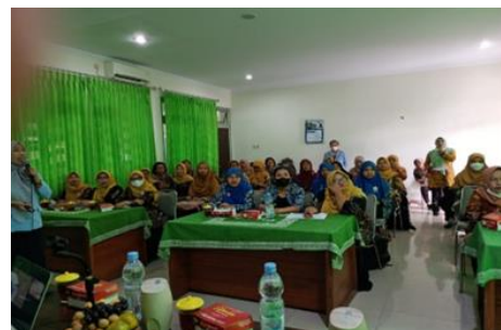
Gambar 1. Tim Pelaksana PkM Gambar 2. Pelaksanaan Penyuluhan

Tahap Pelaksanaan , dilaksanakan pada hari Selasa tanggal 6 Agustus 2024 pukul 09.00-12.30 Wib. di Ruang Serbaguna Kapanewon Mlati dengan susunan acara berikut: