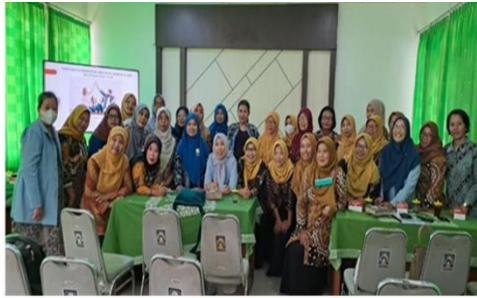
Gambar 5. Tim Penyuluh dan Peserta