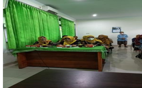
Gambar 4. Sesi Tanya Jawab

Ibu-ibu yang hadir sangat senang dan antusias menyimak materi yang disampaikan, serta tertarik dengan simulasi mengenalkan Bahasa Inggris kepada anak melalui gambar, lagu dan gerak, permainan yang menyenangkan lainnya yang dapat menarik minat anak. Banyak pertanyaan diajukan terkait cara memberikan motivasi dan mendampingi anak untuk belajar Bahasa Inggris sejak dini yang kurang dipahami peserta selama ini.