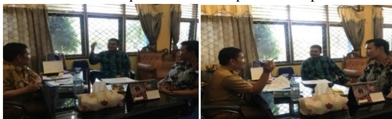
Gambar 2. Diskusi Bersama Camat Kecamatan Jambi Luar Kota

Dari hasil diskusi awal, diketahui bahwa pihak kec. dan Forum Komunikasi Kepala Desa Kec. Jambi Luar Kota sangat memahami posisi strategis Kec. Jambi Luar Kota sebagai kec. penyangga perkotaan. Namun, pemahaman tersebut belum dimanfaatkan dengan baik karena kurangnya pemahaman kepala desa tentang cara mengelola posisi strategis tersebut. Hal ini dikarenakan lemahnya pemahaman kepala desa tentang konsep tata kelola pemerintahan desa, serta kurangnya kesiapan pemerintah desa melakukan perubahan terhadap tata kelola pemerintahan selama ini.