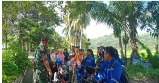
Gambar 1. Babinsa Koramil Samadua Memberikan arahan kepada Mahasiswa dan Masyarakat

Pada tahap awal, dilakukan sosialisasi kepada masyarakat guna memperoleh pengetahuan tentang teknik pengukuran dengan alat GPS yang benar. Materi penyuluhan meliputi teknik mengukur dengan mengambil titik-titik koordinat di batas lahan dengan GPS Garmin metode waypoint .