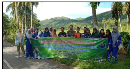
Gambar 2. Foto Kegiatan PKM

Sebelum kegiatan dimulai, mahasiswa mendengarkan arahan Babinsa Koramil Samadua tentang kegiatan PKM yang akan dilakukan, baik pengukuran, batas-batas sawah yang harus diukur dan kesempatan kerja harus diperhatikan saat pengukuran guna menghindari hal yang tidak diinginkan.