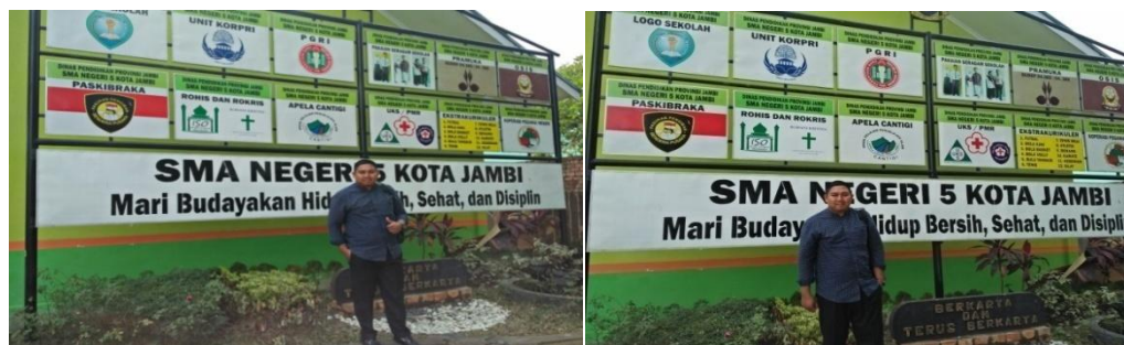
Gambar 1. Diskusi Bersama Pihak SMAN 5 Kota Jambi