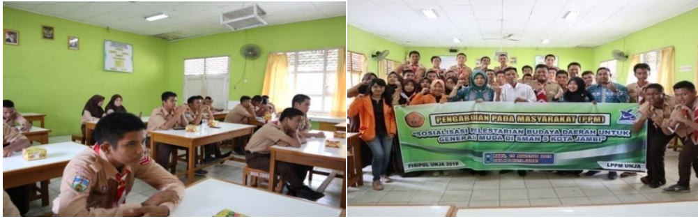
Gambar 3. Kegiatan Sosialisasi di SMAN 5 Kota Jambi

Saat kegiatan sosialisasi berlangsung, terlihat wajah antusias dari siswa yang mengikuti pemaparan yang diberikan. Sesekali beberapa siswa meminta kepada pemateri untuk mempraktekkan cara berseloko adat melayu Jambi dan sebagainya. Kegiatan sosialisasi ini mendapat sambutan yang sangat baik. Berdasarkan hasil wawancara dan isi kuesioner dengan peserta mengenai tanggapan atas terselenggaranya kegiatan sosialisasi ini, diperoleh hal-hal berikut: 1) materi sosialisasi pelestarian budaya daerah bagi generasi muda yang disampaikan oleh pihak LAM Kota Jambi bersama tim PKM dari Universitas Jambi sangat menarik dan peserta mendapatkan wawasan tambahan mengenai tata cara pelestarian budaya daerah Jambi; 2) kegiatan sosialisasi ini juga dinilai sangat bermanfaat bagi peserta dengan harapan akan ada kegiatan lanjutan yang berkaitan dengan pelestarian budaya daerah; dan 3) memasuki era globalisasi yang penuh dengan keterbukaan serta didukung oleh kemajuan teknologi yang sangat pesat, membuat peserta lebih sadar untuk menjaga budaya daerah agar tidak punah dan kalah dari budaya asing yang masuk ke Kota Jambi.