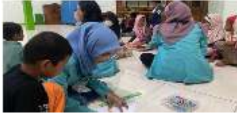
Gambar 1. Kegiatan Diskusi dengan Anak-anak

jawab. Setelah materi selesai didiskusikan, dilanjutkan dengan diskusi mengenai PR yang diberikan sekolah. Selama kegiatan diskusi materi maupun PR, anak-anak terlihat sangat antusias, anak-anak aktif menjawab pertanyaan yang dilontarkan pengajar ketika berdiskusi. Selain itu, anak-anak terbantu menyelesaikan PR nya.