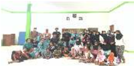
Gambar 2. Foto Bersama Program Pendem Belajar

Setelah berlangsungnya kegiatan diskusi, dilakukan ice breaking seperti menyanyi yel-yel dan tepuk bersama. Melalui ice breaking ini, anak-anak menjadi senang dan fresh kembali sehingga mampu meningkatkan semangat belajar anak. Pada tanggal 12 Agustus 2022, dilaksanakan kegiatan tambahan LCC (Lomba Cerdas Cermat), yang diikuti siswa SD kelas IV, V dan VI. Melalui kegiatan ini, pengetahuan anak bertambah serta dapat melatih otaknya untuk berpikir cepat dalam menyelesaikan permasalahan.