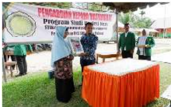
Gambar 2. Penyerahan Bantuan Kotak P3K beserta Obat dan Perlengkapannya