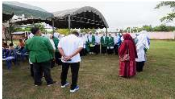
Gambar 1. Kegiatan UKS yang dibantu oleh Mahasiswa Profesi NERS Praktik Komunitas STIKes Muhammadiyah Lhokseumawe

Berikut dokumentasi kegiatan pengabdian masyarakat di SDN 15 Kuta Makmur :