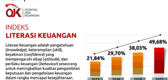
Gambar 1. Indeks Literasi Keuangan, 2022

Berdasarkan data survei OJK pada 2018 mencatat tingkat literasi keuangan Indonesia baru mencapai 29,7%, namun terus meningkat. Hasil SNLIK 2022 menunjukkan indeks literasi keuangan masyarakat Indonesia sebesar 49,68 persen, naik dibanding tahun 2019 yang hanya 38,03 persen.