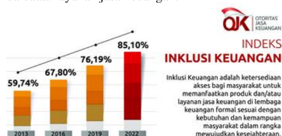
Gambar 2. Indeks Inklusi Keuangan, 2022

akses bagi masyarakat untuk memanfaatkan produk dan/atau layanan jasa keuangan.