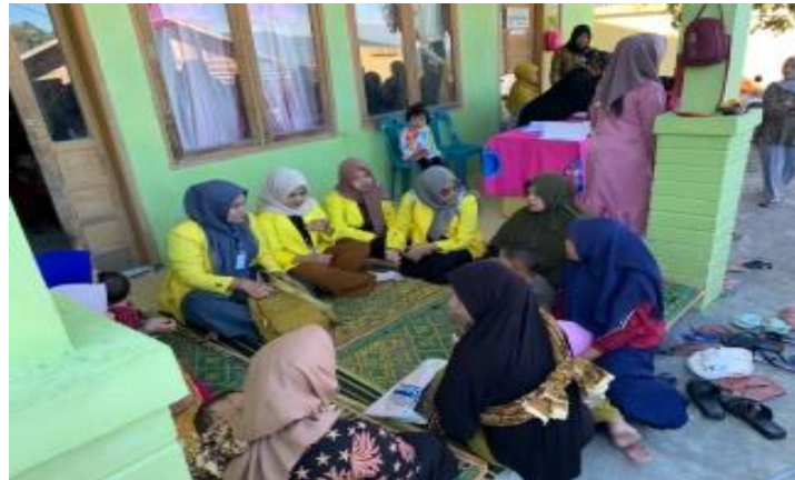
Gambar 2. Observasi awal dan pengambilan informasi data stunting Desa Wih Bersih pada kegiatan Posyandu

Berdasarkan hasil survei data posyandu diketahui bahwa Desa Wih Bersih merupakan salah satu desa di Kecamatan Silih Nara, Kabupaten Aceh Tengah, yang mempunyai data stunting tinggi dengan persentase mencapai 19,04%, dimana dari 21 anak dan balita terdapat 4 diantaranya yang terkena stunting (Gambar 2).