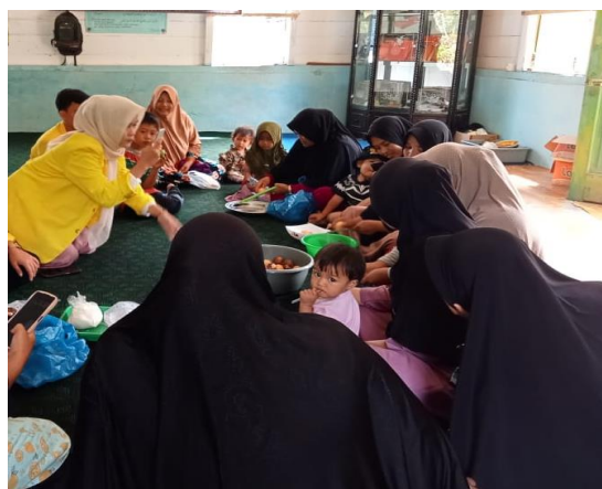
Gambar 4. Kegiatan demonstrasi pembuatan puding alpukat

Kegiatan ditutup dengan membagikan puding alpukat yang telah dibuat pada anak-anak dan ibu-ibu yang hadir dalam kegiatan dan pembagian gizi berupa buah-buahan, kacang-kacangan, roti dan susu yang telah disiapkan oleh para anggota kelompok pengabdian di Desa Wih Bersih.