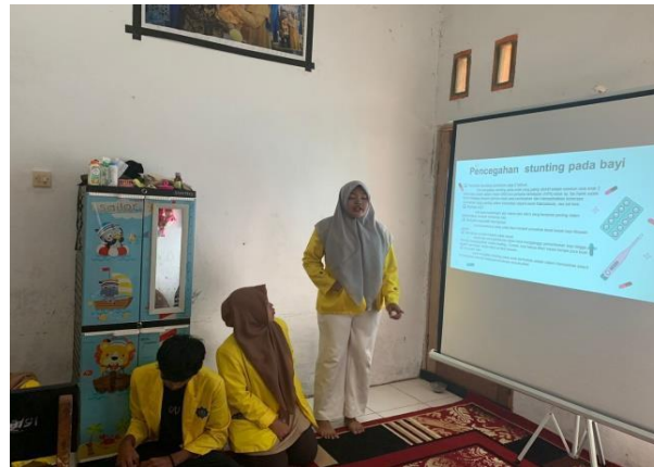
Gambar 3. Pemaparan materi sosialisasi tentang stunting dan pencegahannya

Setelah melakukan pengenalan produk, para peserta diajak untuk membuat puding bersama (Gambar 4). Alpukat akan diolah menjadi puding, karena anak-anak sendiri kurang suka dengan alpukat yang rasanya tidak terlalu enak jika dimakan langsung. Selain dimakan secara langsung alpukat juga sering kali dijadikan jus yang mana harganya lebih mahal, maka dari itu olahan puding dibuat agar semua kalangan dapat menikmatinya.