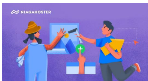
Gambar 7. Desain website

Desain website adalah aspek yang meliputi tata letak, jenis font, dan elemen visual lainnya yang merepresentasikan konten website. Dengan desain situs web yang baik, pengunjung merasa nyaman dan mudah dalam mengakses informasi yang disajikan. Desain website juga harus responsif, yaitu dapat menyesuaikan tampilan sesuai perangkat yang digunakan oleh pengunjung.