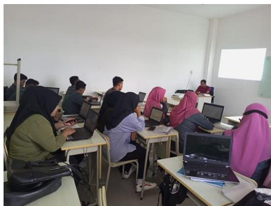
Gambar 7. Latihan Website