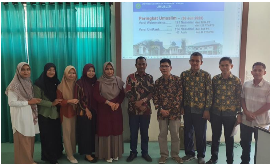
Gambar 2. Peserta Bimtek Pengelolaan Website Universitas Almuslim (3 Agustus 2023)