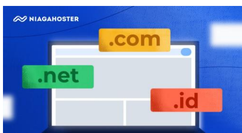
Gambar 3. Domain dalam Website