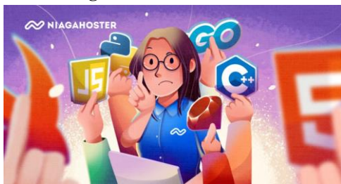
Gambar 5. Bahasa Pemrograman dalam Website