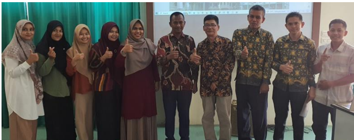
Gambar 1. Peserta Bimtek Pengelolaan Website Universitas Almuslim (3 Agustus 2023)

Maka tujuan utama dari kegiatan bimbingan teknis (Bimtek) ini adalah agar para pengelola website dapat mengelola dan mempublikasikan konten-konten yang berkaitan dengan kegiatannya secara mandiri dan berkesinambungan. Adapun lingkup pengelolaan website ini berada pada level akses administrator. Pengguna administrator adalah seseorang yang ditunjuk pimpinan kerjanya seperti operator fakultas/prodi sebagai pengelola yang mempunyai hak atau kemampuan untuk mengedit, menambah atau menghapus konten website.